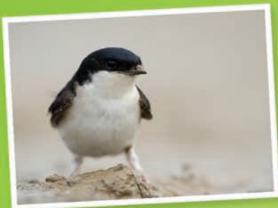
Hirondelle de fenêtre