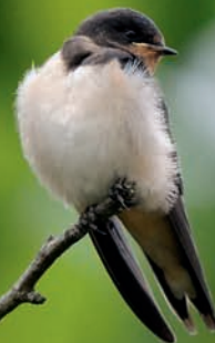
Jeune hirondelle rustique

Annonciatrices du retour du printemps, les hirondelles vivent au plus près de nous : sous les toits ou aux angles des fenêtres en ville, dans les étables ou sous les porches à la campagne, elles sont partout. Mais cette proximité n'est que saisonnière et les hirondelles, grandes dévoreuses d'insectes, doivent fuir vers des destinations lointaines à l'approche de la mauvaise saison, faute de pouvoir se nourrir lorsque les moucherons viennent à manquer.