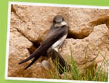
Hirondelle de rivage

Je n'autorise pas la LPO à utiliser mes coordonnées pour m'envoyer de la documentation